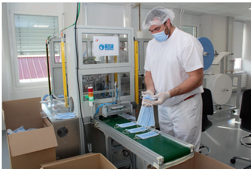
La machine peut produire jusqu'à 90 masques à la minute, soit environ 5400 unités à l'heure.

Lors de la première vague d'infection au coronavirus, l'approvisionnement en masques, principalement fabriqués en Chine, était difficilement assuré. Les responsables de l'entreprise de L'Auberson ont alors imaginé fabriquer ces objets directement dans leur usine. « Nous avons fait un business plan. Notre banque nous a fait confiance et nous avons pu aller de l'avant », se réjouit le chef d'entreprise. La marque ATJ Swiss - ATJ pour Auberson Technologie Jaccard - est créée. La société a donc consenti à un investissement important pour créer des locaux de